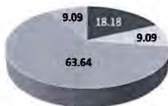
SEMAFORIZACION DE OEIs SEGUN NIVEL DE CUMPLIMIENTO